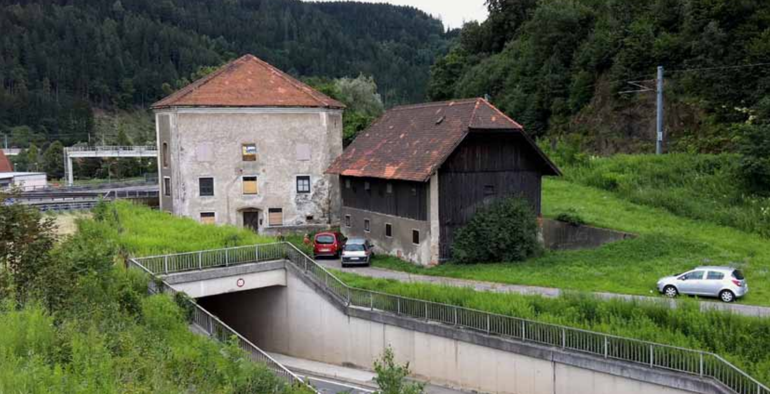
Außenansicht NW / Exterior view NW ©Ernst Fuchs