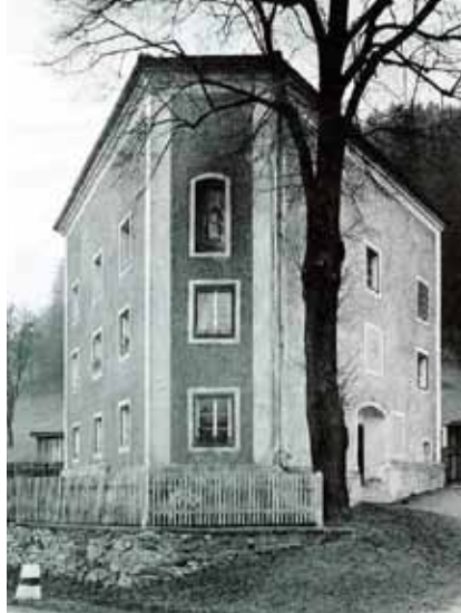
Außenansicht von 1938 mit alter Landstraße Exterior view from 1938 showing the old road

Die Öffentlichkeitsarbeit ist bereits ange laufen. 4 Ein Förder-Verein wurde im April 2012 gegründet. Eine österreichweite Sammelaktion soll nicht nur zur Finanzierung beitragen, sondern auch allgemeines Interesse für dieses Vorhaben wecken und später viele Besucher anlocken.