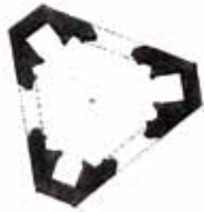
Die von Tempelherren erbauete Heil. Geist-Kapelle. Nächst Bruck an der Mur.