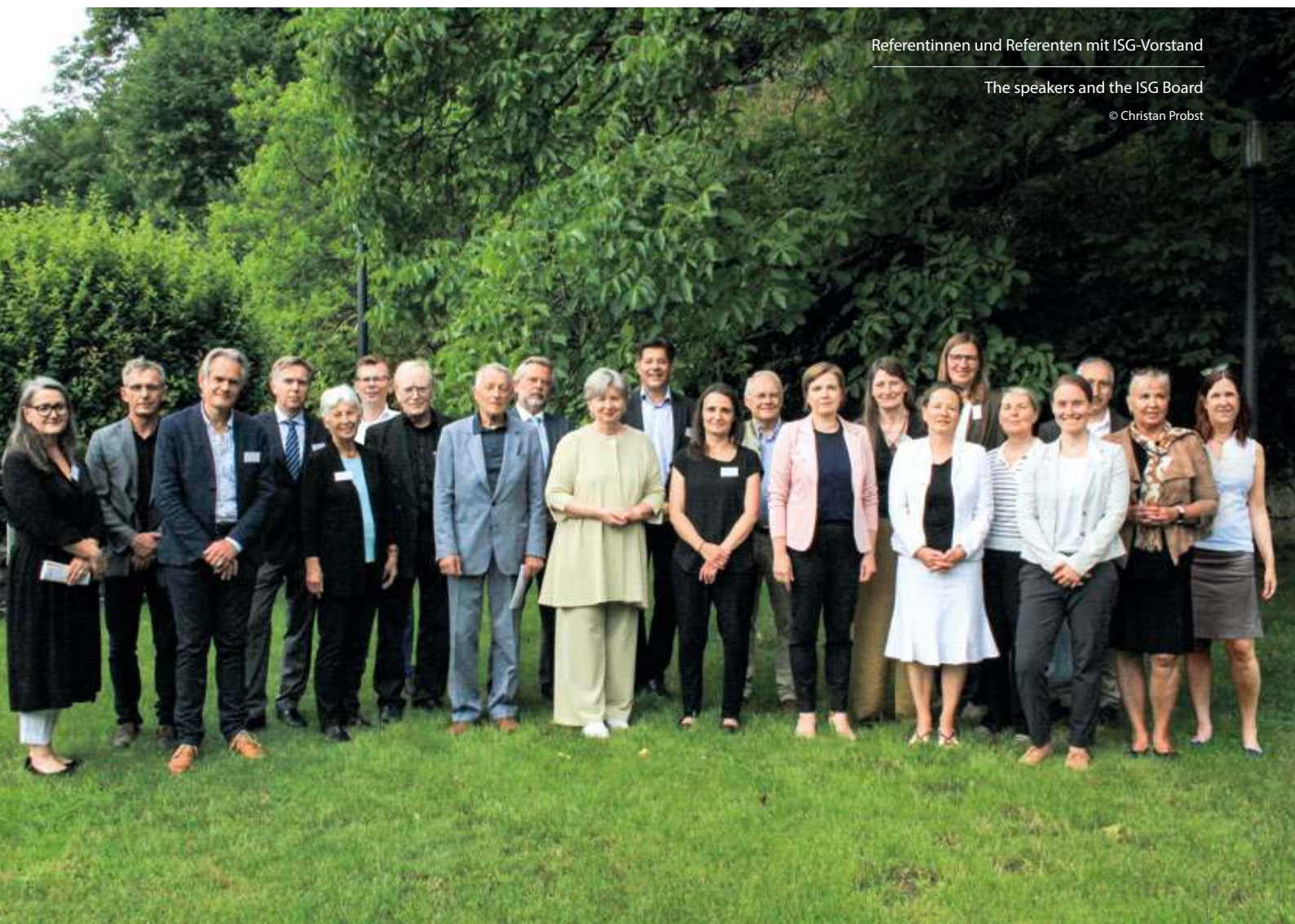
Referentinnen und Referenten mit ISG-Vorstand

Under Restoration – Monument Conservation and World Heritage Protection