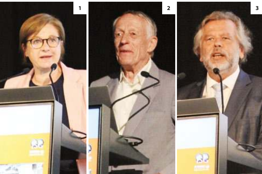
1 Judith Schwentner, Bürgermeisterin-Stellv.in der Stadt Graz und neue ISG-Präsidentin

Deputy Mayor of the City of Graz and new ISG President