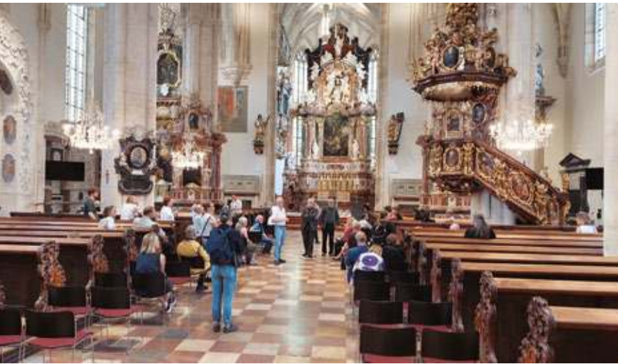
Revitalisierung Grazer Dom