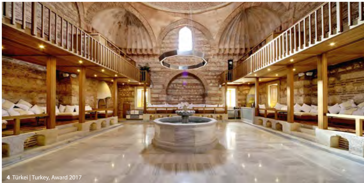
4 Türkei | Turkey, Award 2017

ser Hinsicht zu Recht nicht nur als ein Kulturerbe betrachtet werden, sondern auch als Vorläufer des Gedankens einer europäischen Identität die durch kulturelle Vielfalt geprägt ist.