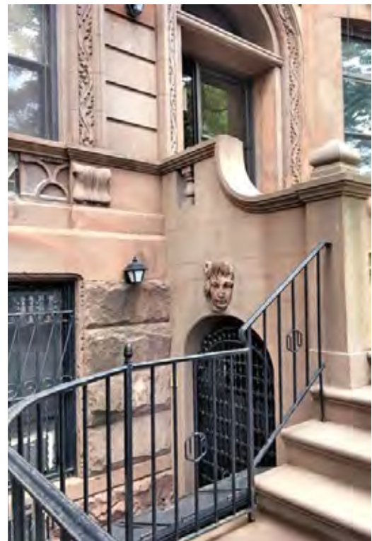
Eingangsbereich eines Sandsteinhauses, 179 West 79th Street, New York, ca. 1870-1890 errichtet

It's been over 50 years since New York enacted its first Landmarks law. Those 50 years have seen an evolution of the law and an ebb and flow of success and failure. The preservation community has learned a lot, after the heady days when preservation was the focus of members of the Landmarks Preservation Commission, about how government can be captured by special interests and what we must do to ensure that the City fulfills its crucial roles as caretaker and protector. It has added skills in the review and assessment of applications to modify designated Landmarks or buildings in historic districts as well as the parsing of legislative language relating to zoning that can undermine the benefits landmarking was meant to create. Our focus has broadened beyond specific buildings and districts to the impact of super-tall buildings and their resultant shadows. Perhaps, most importantly for the future, we have established education programs for the preservationists of the future and their parents. In subsequent articles, these programs will be discussed in more detail along as well the legal issues involved in land use and landmarking.