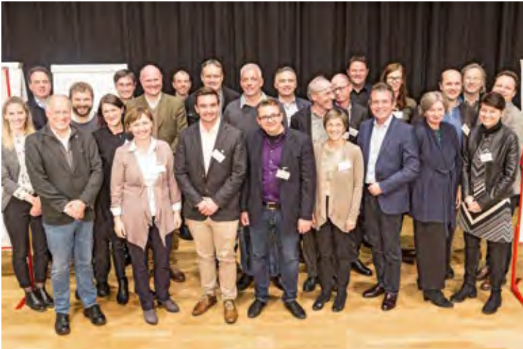
Bürgermeisterkonferenz in Hallwang