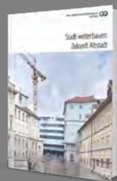
Stadt weiterbauen: Zukunft Altstadt