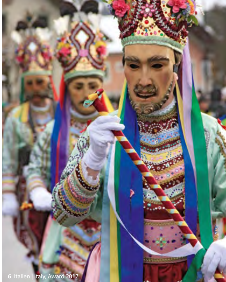
6 Italien | Italy, Award 2017

[1] El Caminito del Rey (Königspfad) in der El Chorro Schlucht, Spanien (2016 | Kategorie 1 | Grand Prix)