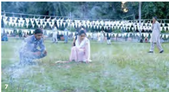
7 [7-9] „Jene, die in den dunklen Gassen ermordet wurden“ "Those who were slaved in the dark alleys" © Awami Art Collective, digital archive