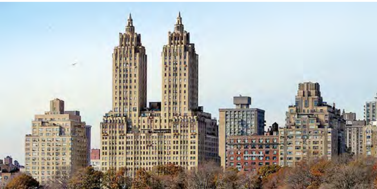
San Remo Appartements im historischen Bezirk Central Park West, Denkmalstatus, 1930 errichtet