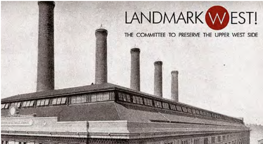
Bildmontage, Landmark West!