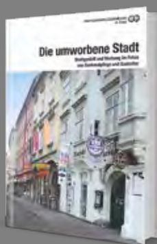
Die umworbene Stadt