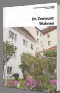
Im Zentrum: Wohnen