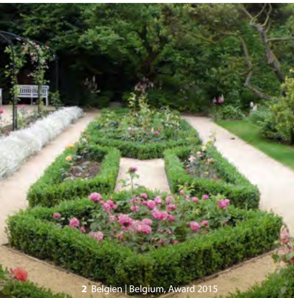
2 Belgien | Belgium, Award 2015