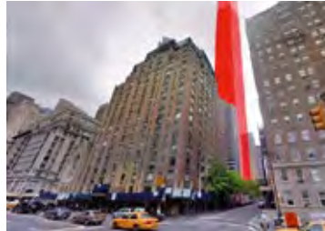
Central dark: Bildmontage, Kampagne gegen überdimensionale Hochhäuser, die die Umgebung zu stark beschatten

züglich der Flächennutzung und der Festlegung von Denkmälern ausführlicher besprochen.