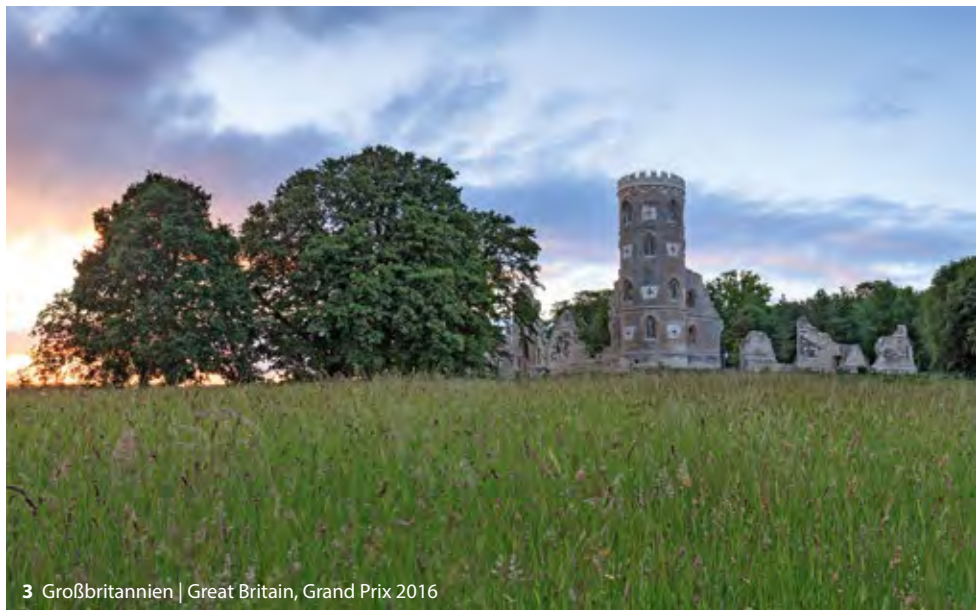
3 Großbritannien | Great Britain, Grand Prix 2016

Das vom Europäischen Parlament beschlossene „Europäische Jahr des Kulturerbes 2018“ (European Year of Cultural Heritage 2018 - EYCH 2018) wird eine der ersten Initiativen zur Würdigung und Förderung des kulturellen Erbes Europas von gesamteuropäischer Tragweite seit dem europäischen Denkmalschutzjahr 1975 sein. Das Ziel ist es, das kollektive Gedächtnis sowie das Bewusstsein für das europäische Kulturerbe und das Gefühl einer europäischen Identität zu festigen. Die Initiative anerkennt Kultur als Europas gemeinsamen Nenner, der Schwerpunkt liegt auf dem Schutz und der Förderung der Vielfalt von kulturellen Ausdrucksformen. Dabei werden materielle, immaterielle und digitale Aspekte des Kulturerbes sowie auch Sammlungen umfassend berücksichtigt.