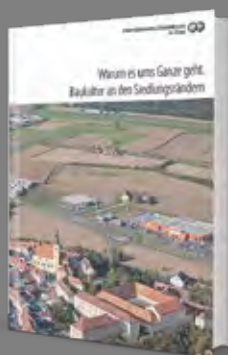
Warum es ums Ganze geht. Baukultur an den Siedlungsrändern