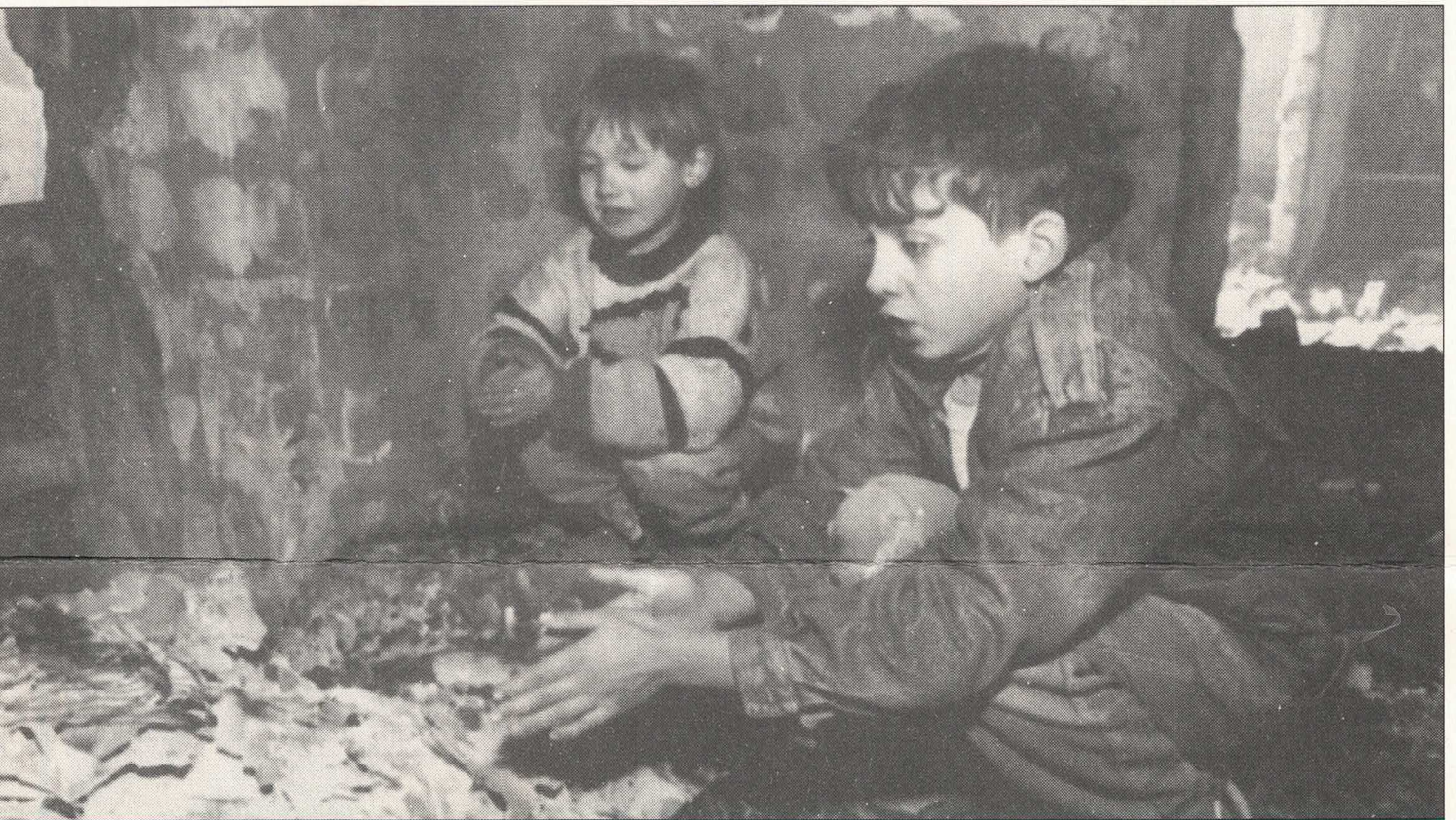
Kinder in Sarajevo wärmen sich die Hände an brennendem Papier. Die Stadt ist zerbombt, verwüstet, den Menschen droht der Hunger- und Kältetod.

Wiederaufbau nach Zerstörungen durch Krieg und Erdbeben Mittwoch, 12. Mai bis Sonntag, 16. Mai 1993