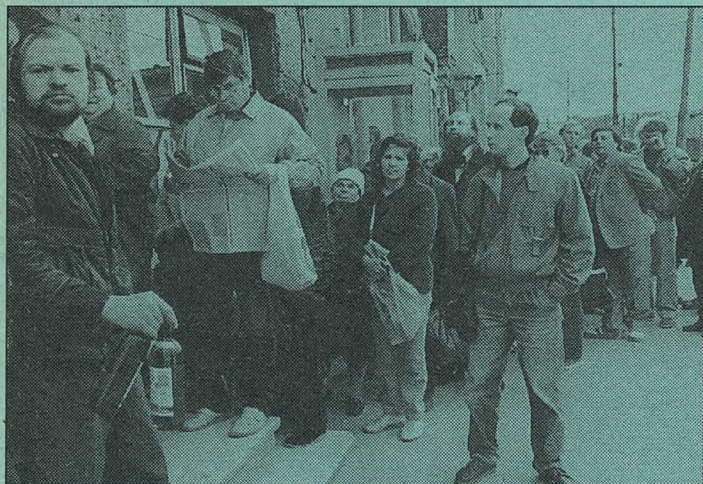
Stundenlanges Schlangestehen vor balbleeren Lebensmittelgeschäften – das ist der bittere Alltag in Großstädten wie Moskau oder St. Petersburg.