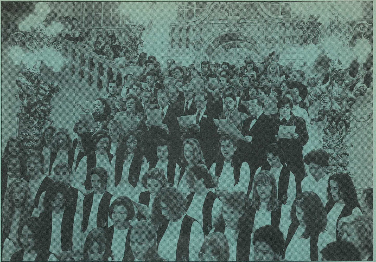
Der 24-Stunden-Marathon in der Grazer Oper erbrachte 1,4 Millionen Schilling für Kinder in Kriegsnot. Zum Schluß erklang im Foyer die Europahymne.

In Kärnten und der Steiermark haben die Landes- und Stadtregerungen spontan mit politischer Verantwortung und sozialem Engagement eingegriffen. Ein 24-Stunden-Künstler-Marathon in der Grazer Oper (Vereinigte Bühnen-„Kleine Zeitung“) hat am 24. November über 1,4 Millionen Schilling für „Kinder in Kriegsnot“ erbracht. In diesen Tagen setzte der aus Graz stammende Schauspieler Karl Heinz Böhm seine Aktion „Menschen für Menschen“ zugunsten der Hungernden Äthiopiens erfolgreich fort – ein ebenso wichtiger Aspekt angesichts des Wegschauens vom Elend in der Dritten Welt.