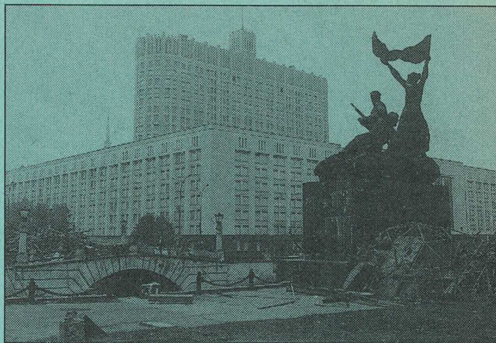
Vor dem „Weißen Haus“ in Moskau, Sitz des russischen Präsidenten und des russischen Parlaments, liegen noch immer Barrikadenrümpfer aus den Putschtagen vom 19. bis 21. August 1991. Ein nächster Aufstand könnte die befürchtete „Hungerrevolte“ sein.

Der amerikanische Botschafter in Moskau, Robert Strauss, hat kürzlich in einem Interview mit der US-Fernsehanstalt CBS erklärt, Washington sollte Moskau mit „einigen Milliarden Dollar“ über den Winter helfen und so den Erfolg der Demokratie ermöglichen. Strauss meinte, für die USA gäbe es keine bessere Investition, zumal die vielen Millionen Menschen „furchtbar