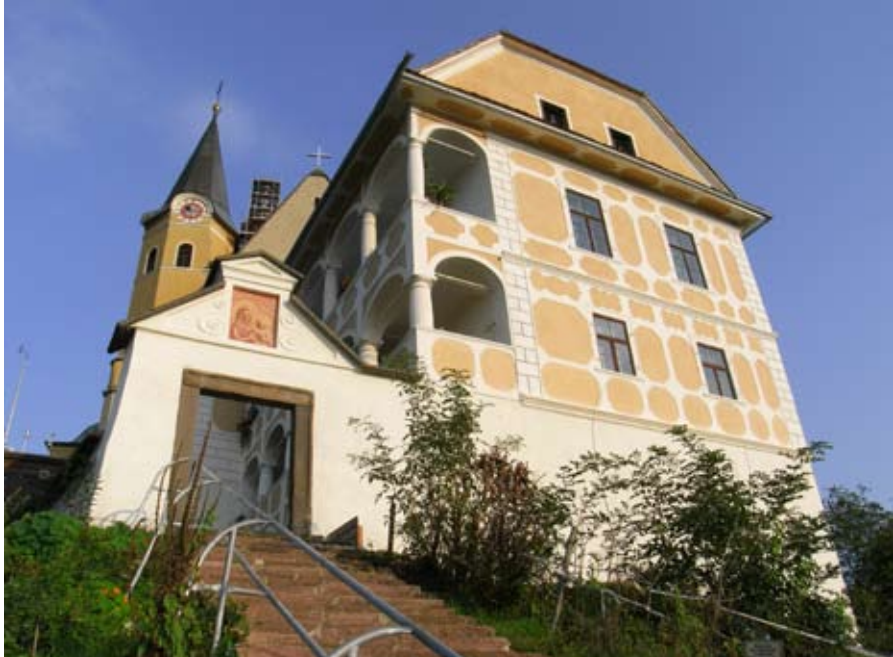
Das Prälatenhaus von Nordwesten.