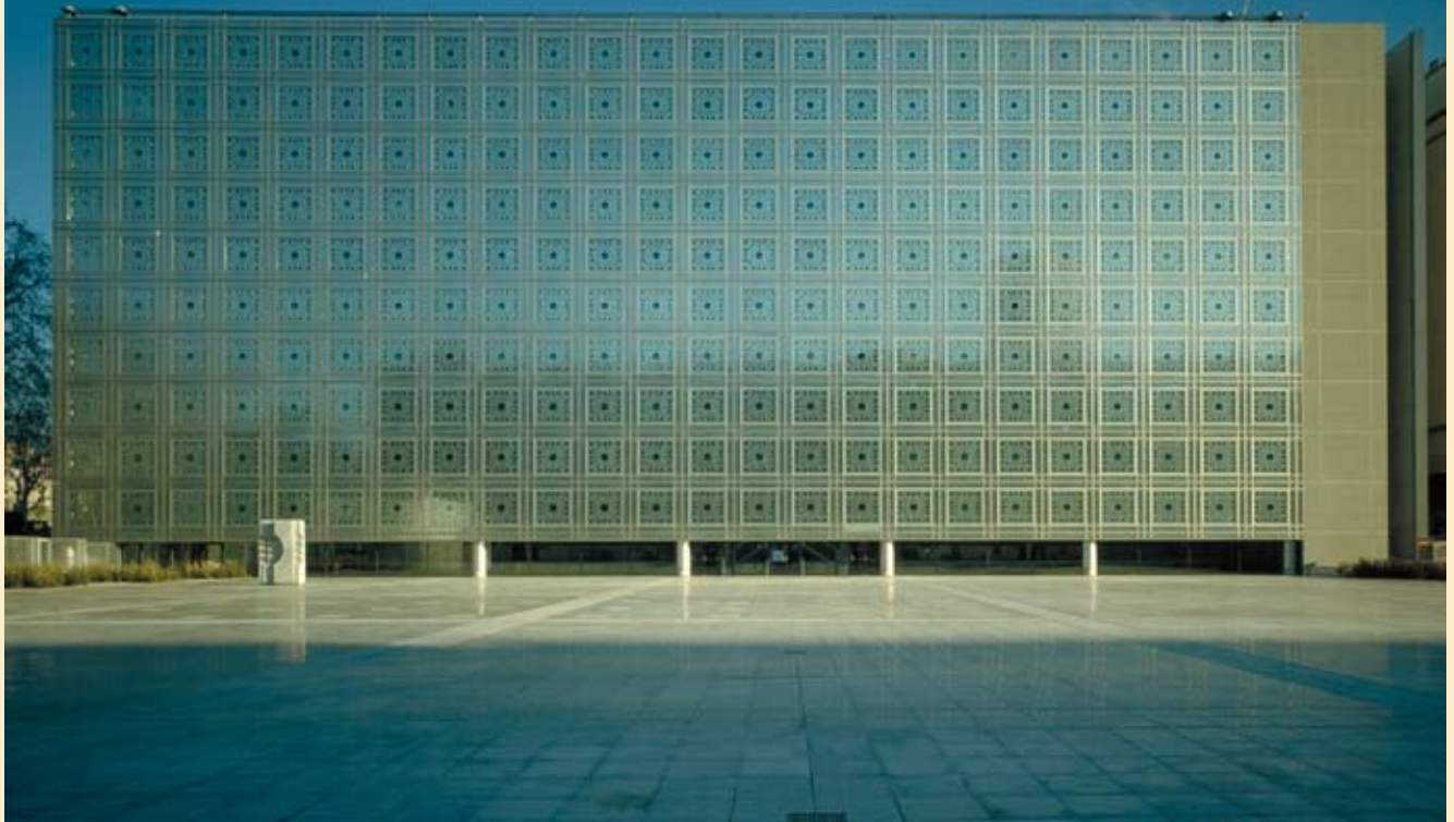
Der Museumskomplex „Institut du Monde Arabe“ in Paris von Jean Nouvel (1987).