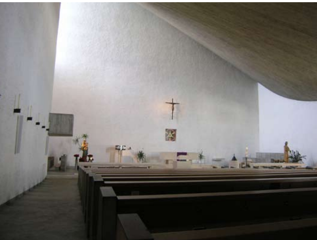
Bruder-Klaus Kirche in St.Gallen-Winkeln.