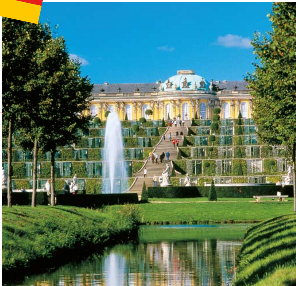
Schloss Sanssouci ist eines der bekanntesten Hohenzollernschlösser der brandenburgischen Landeshauptstadt Potsdam; 1744 gab Friedrich der Große den Auftrag zur Anlage der Weinterrassen.

2008 steht der Welterbetag unter dem Motto „Schülerinnen und Schüler sehen ihr UNESCO-Welterbe“. Die zentrale Veranstaltung wird von der Welterbestätte Aachener Dom ausgerichtet, bundesweit wird der Welterbetag durch zahlreiche Veranstaltungen und Aktionen begleitet. Anlässlich des Tages der Deutschen Einheit hat der Verein im Jahr 2003 außerdem eine Fotoausstellung zum Thema UNESCO-Welterbe in Deutschland erarbeitet, die seitdem sehr erfolgreich durch ganz Deutschland wandert. Durch die intensive vereinsinterne Kommunikationspolitik werden alle Mitglieder ständig über die