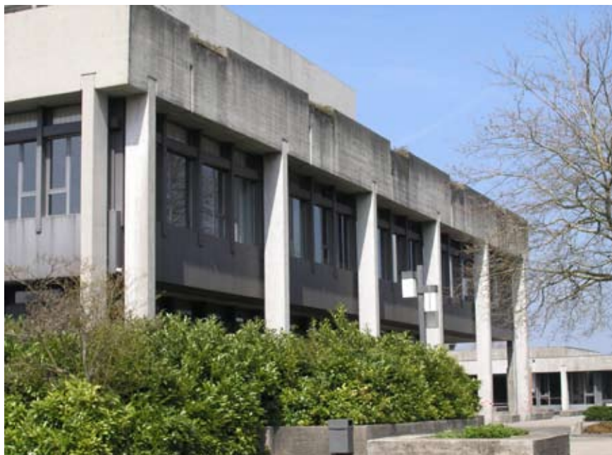
Universität St.Gallen auf dem Rosenberg.