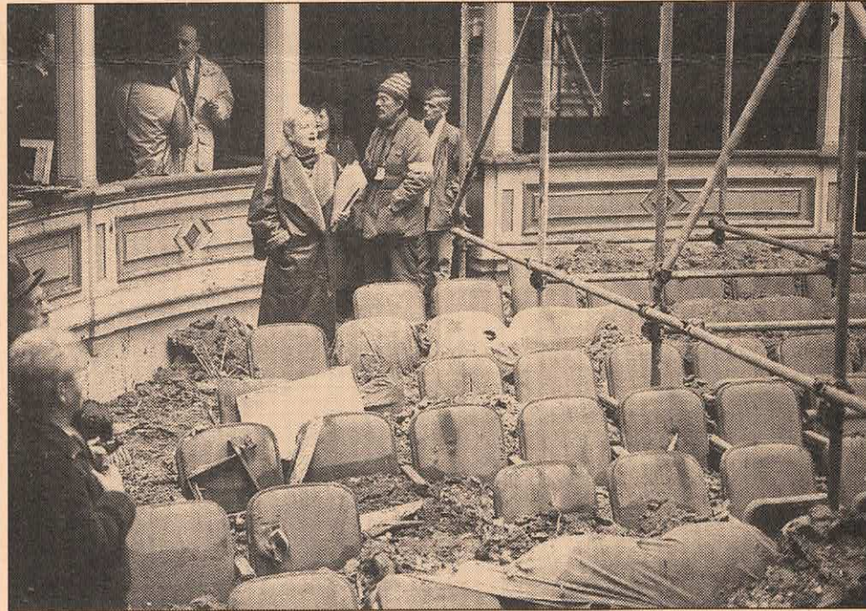
Bild oben: Hauptziele der Angriffe waren immer wieder Sakral- und Kulturbauten.