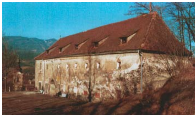
Vor der Sanierung.

Baufällig geworden verwendete man ab 1816 das Material der Anlage zum Hausbau in Leoben, nur das Wirtschaftsgebäude blieb erhalten. 1937 ließ die Stadtgemeinde Leoben den Schutt der Ruinen entfernen, den Grundriss der alten Burg freilegen und die Mauern teilweise restaurieren. Im Jahr 2000 kam es im Zuge einer weiteren Sanierung zur Errichtung einer stählernen Aussichtsplattform, die unter Denkmalpflegern nicht unumstritten ist.