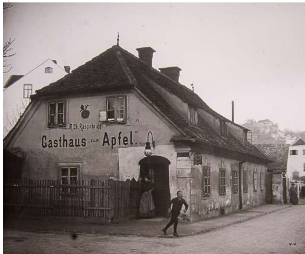
Gasthaus zum Apfel.