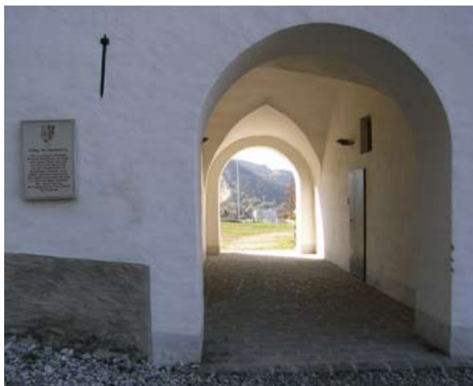
Torsituation mit Zuganker 2008.

In den Jahren 2006 - 2008 wurde das bereits sehr desolante zweigeschossige Wirtschaftsgebäude einer Generalsanierung unter denkmalpflegerischen Gesichtspunkten unterzogen. Durch die Adaptierungsmaßnahmen – finanziert auch aus Mitteln des Revitalisierungsfonds Steiermark – entstanden qualitätvolle Räumlichkeiten für Dienstleistungs- und Ausstellungszwecke, so ist im Erdgeschoss eine Keramikwerkstätte mit angeschlossenen Atelier untergebracht.