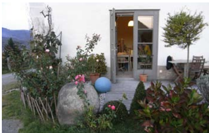
Fassadenschnitt im Bereich des Keramik-Ateliers.

In den Jahren 2006 - 2008 wurde das bereits sehr desolante zweigeschossige Wirtschaftsgebäude einer Generalsanierung unter denkmalpflegerischen Gesichtspunkten unterzogen. Durch die Adaptierungsmaßnahmen – finanziert auch aus Mitteln des Revitalisierungsfonds Steiermark – entstanden qualitätvolle Räumlichkeiten für Dienstleistungs- und Ausstellungszwecke, so ist im Erdgeschoss eine Keramikwerkstätte mit angeschlossenen Atelier untergebracht.