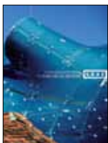
Letzte Umschlagseite/Back Cover Soeben erschienen: Das Buch „10 Jahre UNESCO-Welterbe Graz“. Just published: „10 Years UNESCO-World Heritage Graz“.