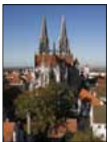
3. Umschlagseite/3 rd Cover Der Dom St. Peter in Regensburg ist das Hauptwerk der Gotik in Bayern. St. Peter's Cathedral in Regensburg is a masterpiece of Gothic architecture in Bavaria.