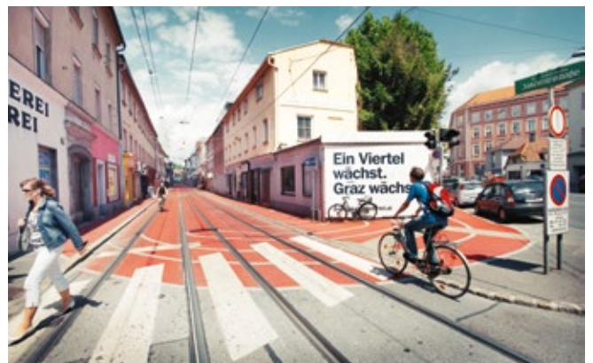
Coverfotos: © Christian Probst, Fotocredits siehe jeweiligen Artikel