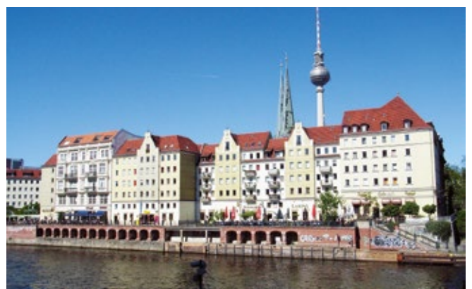
Coverfoto: © DomRömer GmbH, Fotocredits siehe jeweiligen Artikel